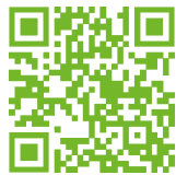
Perfil a Instagram