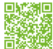
Canal a YouTube